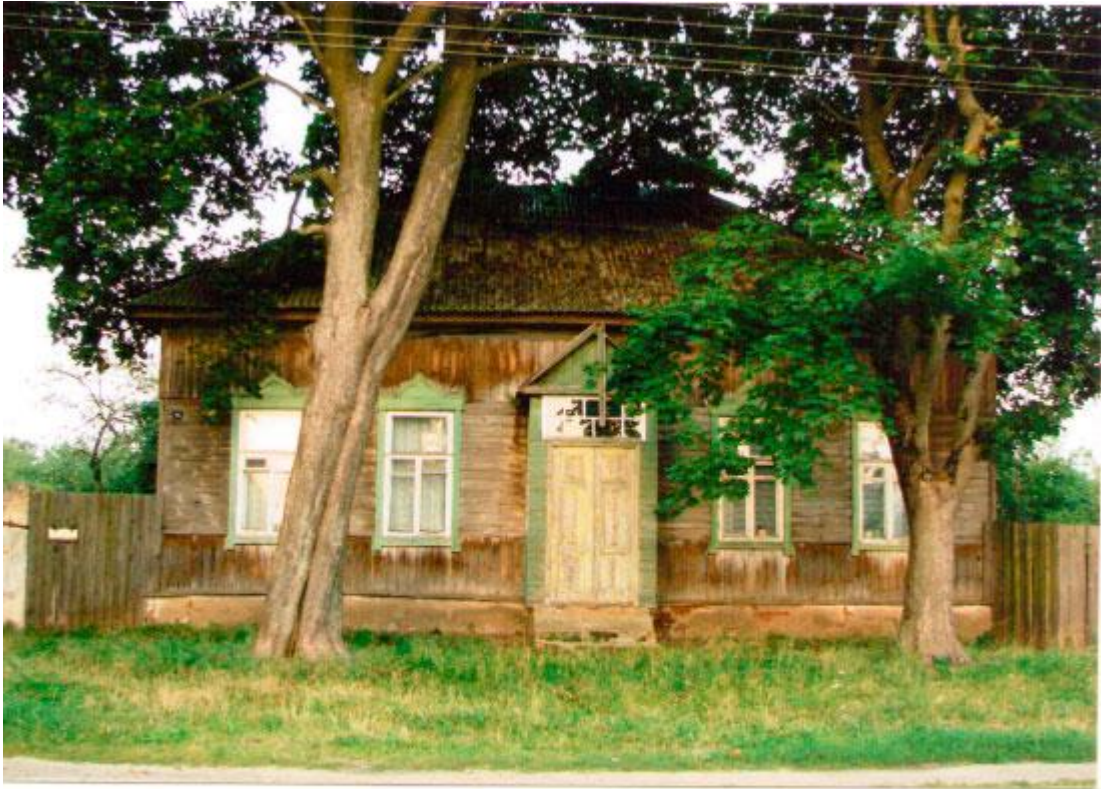
Дом “пад разгатаю таполей” па вуліцы Чкалава, дзе адпачываў і працаваў пісьменнік.

Добрая атмосфера дзедзінскай хаты ў Рагачове спрыяла і таму, што якраз тут зімой і вясной 1966г. Караткевіч канчаў свой раман “Хрыстос прыязмліўся ў Гародні”. Галоўны герой гэтага твора Юрась Братчык з’яўляецца духоўным братам не толькі Гервасію Выліваху, але і такім сусветна вядомым вобразам, як Пантагруэль, Ціль Уленшпігель, Кала Бруньён.