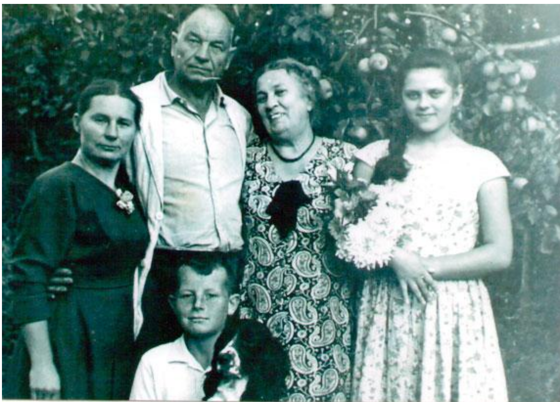
Горад Рагачоў. Радня пісьменніка.