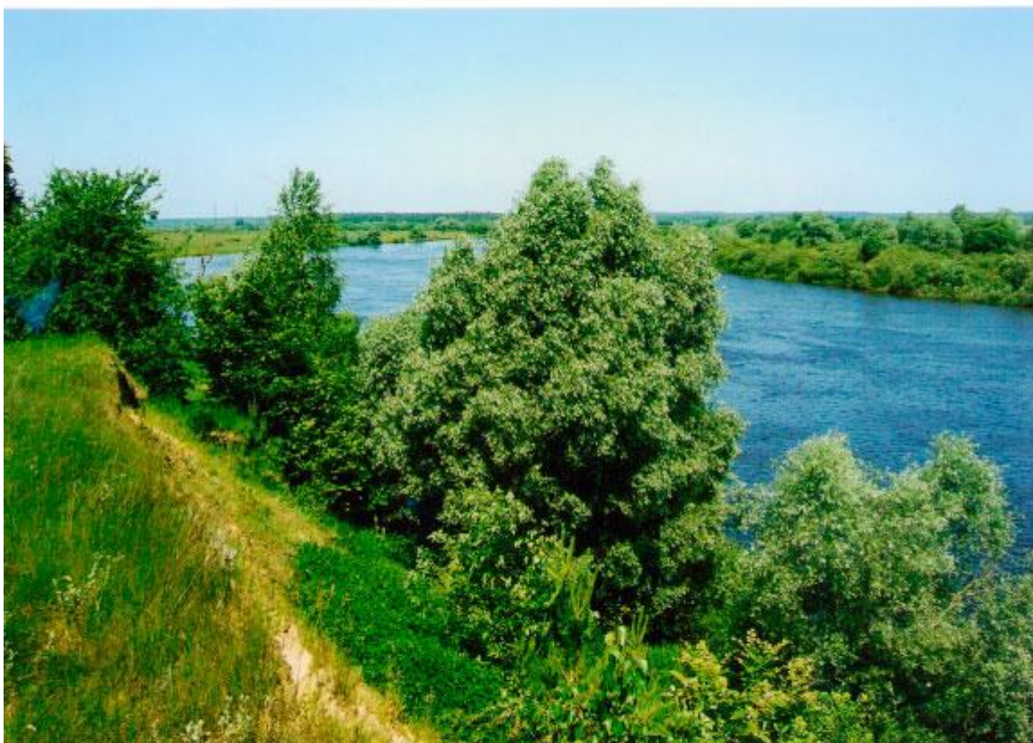
Любімая рака пісьменніка – Дняпро.

Не заверне шлях мой на шляхі чужыя, Заўсёды дарагімі будуць мне Зарэчча, горад, хвоі залатыя, Ашыткі на прароўскім мулкім дне.